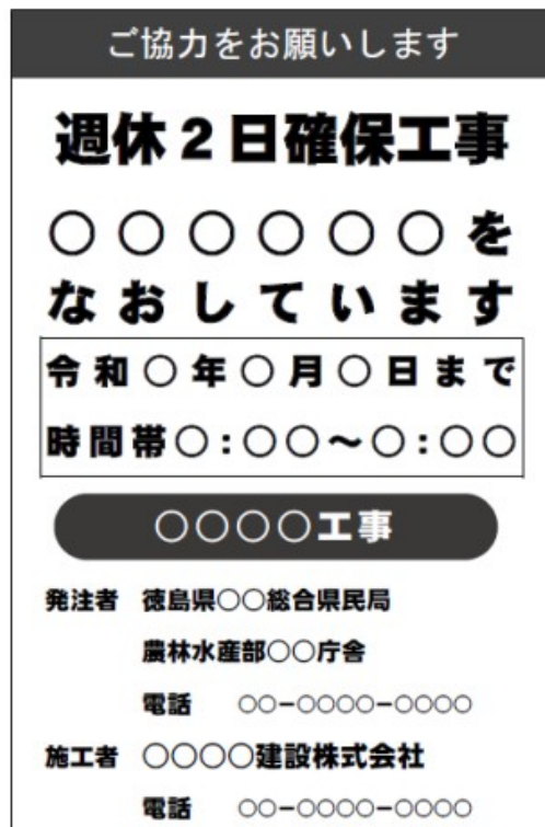
(標示板記載例) 月単位の場合

週休2日確保工事等実施要領 徳島県 HP https://www.pref.tokushima.lg.jp/jigyoshanokata/sangyo/nogyo/5016651/